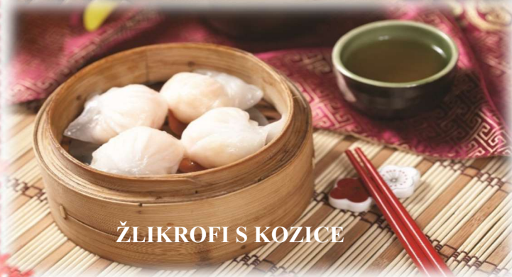
ŽLIKROFI S KOZICE