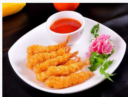
ROLA ZLATI KOZICE