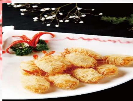
KROGLE ZLATI KOZICE