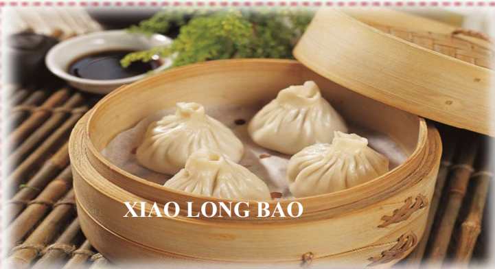
XIAO LONG BAO